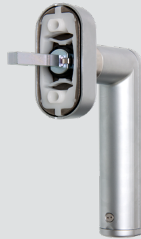
Modellbeispiel 7812 W