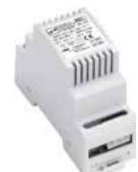
Unterputz- und Hutschiene-Netzteil